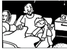
Felix krabbelt in _____ Bett.